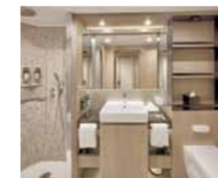
Salle de bain.