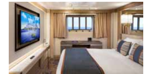
Cabine Expédition sabord Cat. 1 (Pont 3)