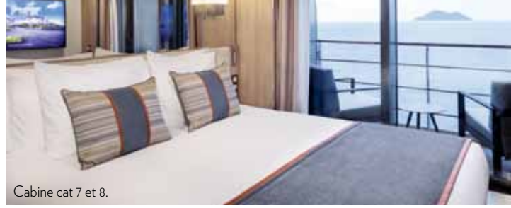
Cabine cat 7 et 8.