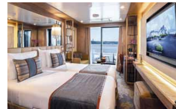
Cabine Deluxe balcon Cat. 4 ou 5 (Pont 5 et 6)

Réparties sur 3 ponts, les cabines du World Explorer ont toutes une vue extérieure . Très spacieuses, elles mesurent de 17 à 44 m 2 . Elles bénéficient d'un coin salon avec table, fauteuils et sofa. Elles disposent toutes de deux lits jumeaux rapprochables, d'une télévision, d'un mini bar, d'une climatisation individuelle, d'un sèche-cheveux et d'un coffre-fort. Toutes les suites bénéficient d'une terrasse équipée (en plus de 2 fauteuils et d'une table basse, 2 transats bain de soleil). Certaines suites bénéficient dans la salle de bain, de 2 vasques et d'une baignoire, en plus de la douche à l'italienne.